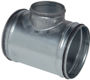
Haaks T-stuk met afdichtingen

De TE 90° met afdichtingen verbindt 2 gegalvaniseerde buizen onder een hoek van 90°, waarbij de verbinding luchtdichtheidsklasse C heeft.