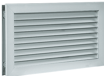
Rooster AC 181

De doorvoerrooster AC 181 wordt gebruikt voor de luchtcirculatie van 1 lokaal naar een ander. Hij biedt geen inzicht waardoor de privacy bewaard blijft.