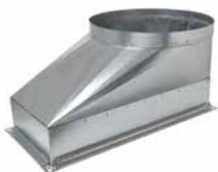
Pièce de transformation rectangulaire/circulaire VEX600