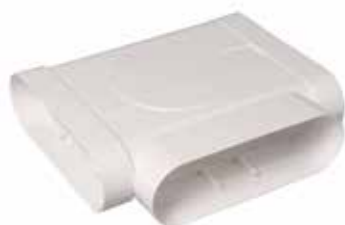
Té 90° horizontal