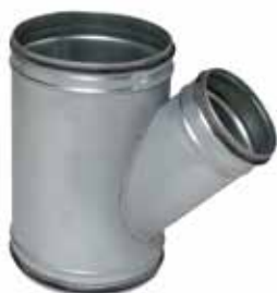
Té Oblique à joints

Le TO à joints permet de raccorder deux conduits galvanisés avec un angle de 45° tout en assurant une étanchéité classe C.