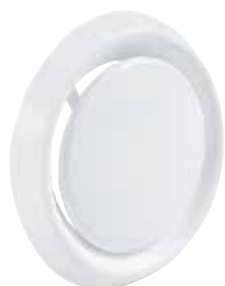
SR 149 D100

La bouche à noyau SR 149 en plastique au débit réglable sur site assure le soufflage ou la reprise d'air.