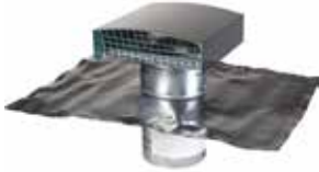
Sortie de Toit Standard

La sortie de toit standard a été conçue pour la VMC et le traitement d'air dans les logements collectifs et les immeubles tertiaires.