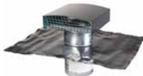
Sortie de Toit Standard

La sortie de toit standard a été conçue pour la VMC et le traitement d'air dans les logements collectifs et les immeubles tertiaires.