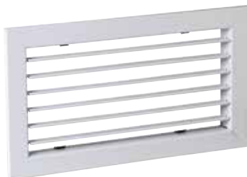
SC101 F3 200X100

La grille murale en acier SC 101 permet la reprise d'air dans un local pour des installations de ventilation ou de conditionnement d'air.