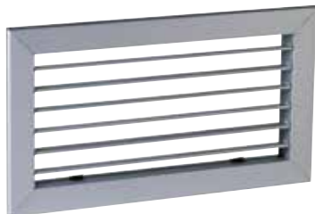
Grille SC 101

La grille murale en acier SC 101 permet la reprise d'air dans un local pour des installations de ventilation ou de conditionnement d'air.