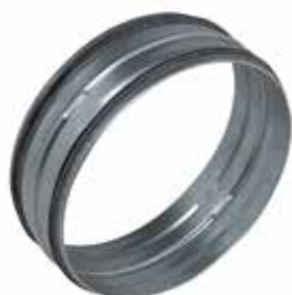
Raccord Mâle à joints

Le raccord mâle à joints permet de raccorder deux conduits galvanisés entre eux tout en assurant une étanchéité classe C.