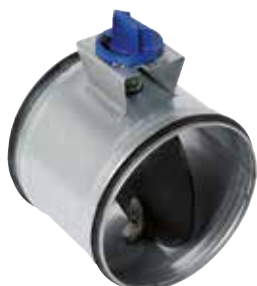
RGE à joint manuel et motorisable

Le registre RGE équilibre et isole manuellement ou avec un moteur un réseau circulaire tout en garantissant un très faible taux de fuite.