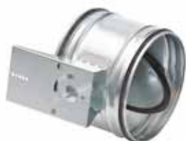
RGE M à joint motorisable

Le registre RGE Motorisable permet d'équilibrer et d'isoler avec un moteur un réseau circulaire tout en garantissant un très faible taux de fuite.