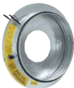
Registre à iris

Le registre à iris permet d'équilibrer finement un réseau circulaire tout en garantissant un très faible taux de fuite (étanchéité classe C).