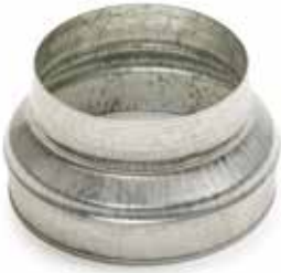
Réduction Conique Concentrique

La RCC permet de raccorder deux conduits galvanisés de diamètres différents entre eux.