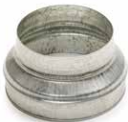
Réduction Conique Concentrique

La RCC permet de raccorder deux conduits galvanisés de diamètres différents entre eux.