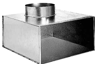
Plénum arrière RT