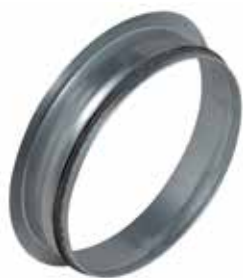
Piquage Equerre sur Plat à joints

Le piquage équerre sur plat à joints permet de réaliser un piquage à 90° sur un conduit de type oblong ou rectangulaire galvanisé.