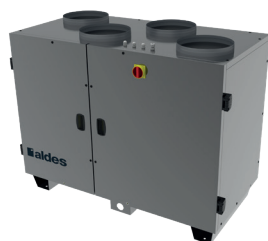
DFE R TOP

La centrale double flux compacte rotative à flux verticaux la plus accessible du marché