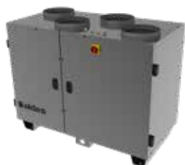
DFE R TOP 400

La centrale double flux compacte rotative à flux verticaux la plus accessible du marché