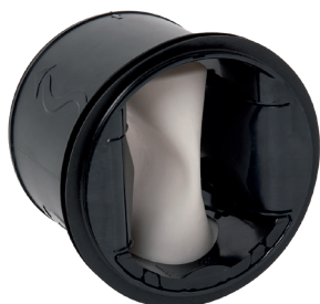
MR Mono D100

Le MR Mono est un régulateur de débit garantissant un débit stable pour maîtriser QAI, confort et économie d'énergie du local.