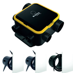
Kit Auto DHU Compact + 3 grilles ColorLINE®

EasyHOME AUTO DHU COMPACT : la VMC autonome qui détecte et régule l'humidité partout dans le logement pour un confort sain et silencieux.