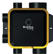
Groupe Auto DHU Compact