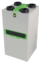
InspirAIR® Top 450 Premium ERV

La solution double flux qui filtre efficacement les polluants les plus fins et s'adapte à vos besoins