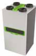
InspirAIR® Top 450 Classic

La solution double flux qui filtre efficacement les polluants les plus fins et s'adapte à vos besoins