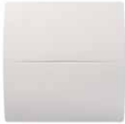
INEA EXPERT 100 vue de face