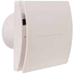
INEA EXPERT 100

INEA EXPERT est un extracteur permanent intelligent, avec adaptation automatique de sa vitesse en fonction des pertes de charge et configuration simplifiée par écran LED.