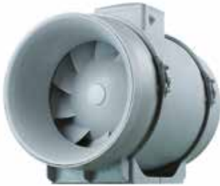
IN LINE XPro

IN LINE XPro est un ventilateur de conduit performant et économe en énergie. Son bloc moteur démontable facilite le montage et la maintenance.