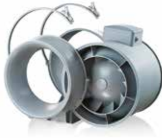
Bloc moteur démontable