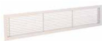
Grille Gridlined wall

La grille murale intérieure fixe en aluminium GRIDLINED Wall est destinée au soufflage et à la reprise de l'air dans les bâtiments tertiaires.