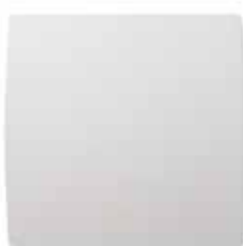
GRAPHIC vue de face