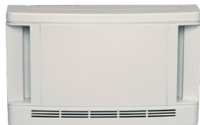
Entrée d'air hygroréglable EHT/EFT²

EHT est une entrée d'air hygroréglable en traversée de mur pour les maisons individuelles et les logements collectifs.