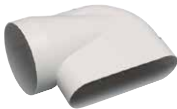
Coude 90° horizontal pour conduit

Coude horizontal 90° pour conduit Ø 125 mm