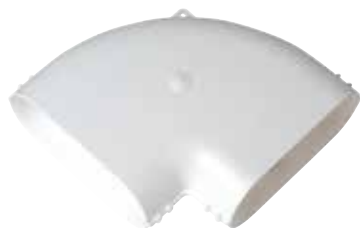
Coude horizontal 90°