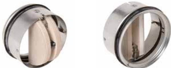
Cartouche CT avec bouche

Les Cartouches Coupe-feu CT-1 et CT-2 ont pour but d'empêcher la propagation du feu en fermant le conduit d'air au niveau de structures anti-feu, les cartouches sont utilisées à destination des bâtiments tertiaires et industriels.