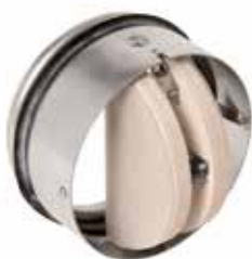
Cartouche CT avec bouche

Les Cartouches Coupe-feu CT-1 et CT-2 ont pour but d'empêcher la propagation du feu en fermant le conduit d'air au niveau de structures anti-feu, les cartouches sont utilisées à destination des bâtiments tertiaires et industriels.