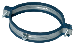
CU galva anti-vibratile