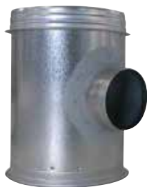
Caisson Piquage pour relevé d'étanchéité

Le caisson piquage pour relevé d'étanchéité permet de joindre et de rendre accessible le réseau collecteur vertical et le réseau horizontal.