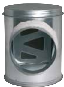
Caisson Piquage Acoustique et Aéraulique

Le CP2A assure la jonction et l'accessibilité du réseau collecteur vertical et du réseau horizontal en améliorant l'acoustique et l'aéraulique.