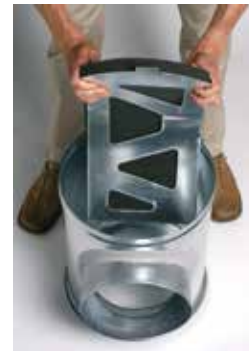
Installation du déflecteur acoustique et aéraulique dans le caisson piquage