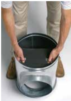
Installation du déflecteur acoustique et aéraulique dans le caisson piquage