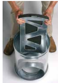
Installation du déflecteur acoustique et aéraulique dans le caisson piquage