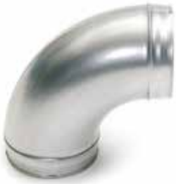
Coude 90° embouti

Le coude 90° permet de changer la direction d'un réseau galvanisé de 90°.