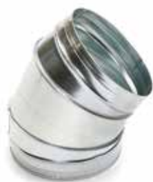
Coude 45° secteur

Le coude 45° permet de changer la direction d'un réseau galvanisé de 45°.