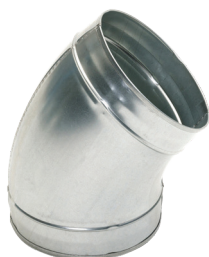
Coude 45° embouti

Le coude 45° permet de changer la direction d'un réseau galvanisé de 45°.