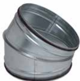
Coude 30° à joints

Le coude 30° à joints permet de changer la direction d'un réseau galvanisé de 30° tout en assurant une étanchéité classe C.