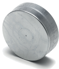
Bouchon Mâle Femelle

Le Bouchon Mâle Femelle permet de boucher un conduit ou un accessoire en acier galvanisé dans les locaux tertiaires et les logements collectifs.