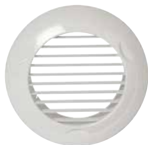
Grille BIP D 80 mm

BIP et BIO sont les grilles de ventilation fixe destinées aux maisons individuelles et logements collectifs.