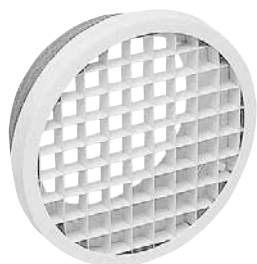
Bouche BEM 780

Le petit terminal BEM 780 permet la reprise d'air dans les petits locaux tertiaires avec une faible perte de charge.