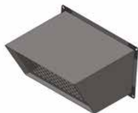
Auvent pare-pluie VEX