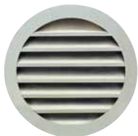
Grille AR 637

La grille extérieure circulaire murale AR 637 permet la prise d'air ou le rejet d'air vicié sans risque d'entrée de pluie grâce à la forme des ailettes.