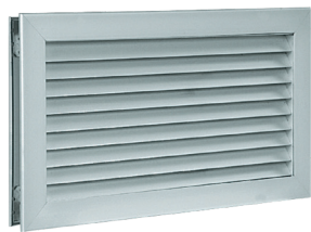
AC 181 F1 200x100

La grille de transfert AC 181 permet la circulation d'air d'un local à un autre tout en préservant l'intimité grâce à sa fonction anti-vue.