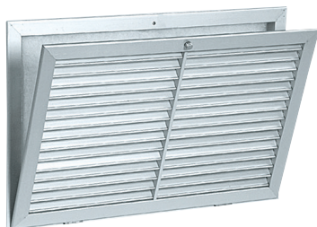
Grille AC 161

La grille murale ouvrante en aluminium avec filtre AC 161 permet la reprise d'air pour des systèmes de ventilation ou de conditionnement d'air.