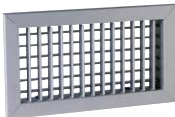
AC 102D F3 200x100

La grille murale AC 102 D en aluminium permet le soufflage d'air dans un local pour des installations de ventilation ou de conditionnement d'air.