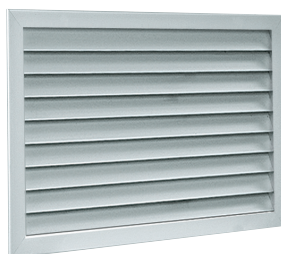
Grille AG 638