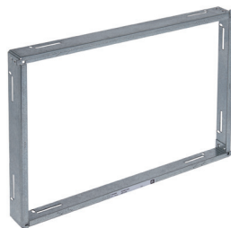
Contre cadre F10